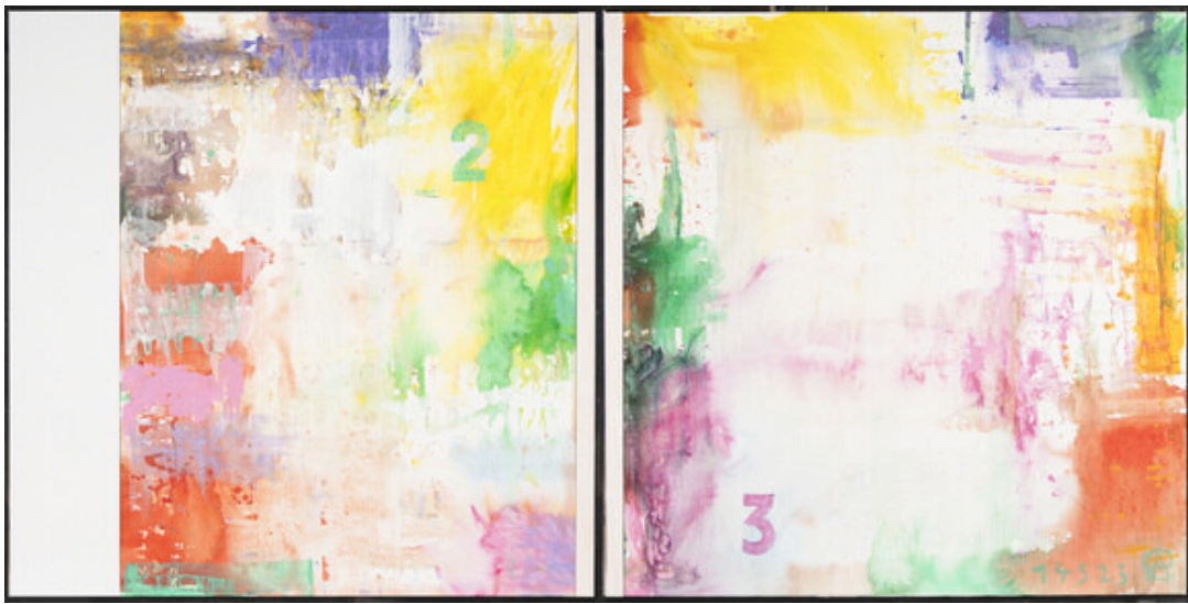
"1,2,3", 2023, Acryl auf Leinwand, 160 x 320 cm