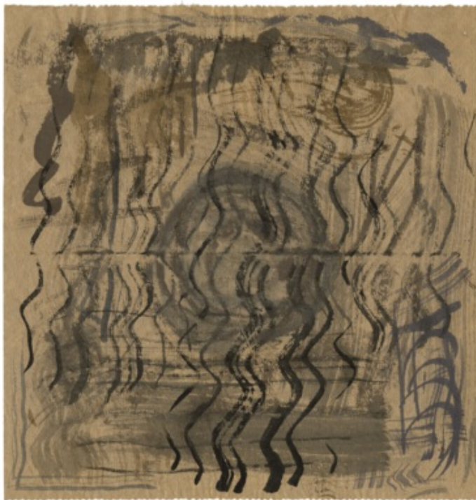
© John Cage, Zen Ox-Herding Pictures: Set Two, Number Ten, 1968, Aquarell auf Papier