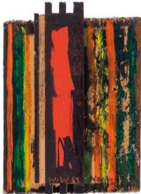
Wacht im Wald, 2001, 16,4 x 11,8 cm, Tusche und Tempera auf Holz