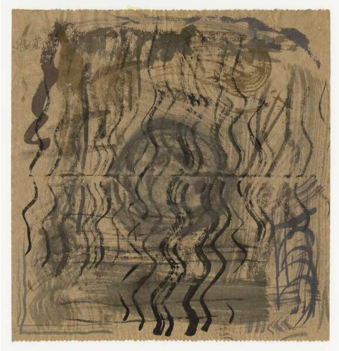
© John Cage, Zen Ox-Herding Pictures: Set 2, #10, 1988

14.09.2023 – 19:00 Uhr | Eröffnung der Ausstellung im Rahmen der Berlin Art Week